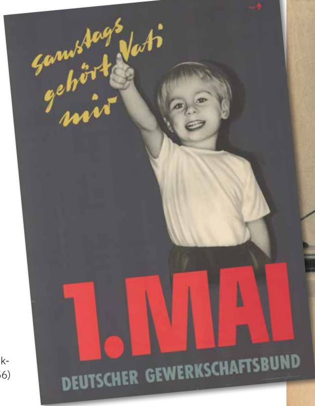
Deutscher Gewerkschaftsbund (1956)

Man sagt: Zeit ist Geld. Und sie heilt alle Wunden. Die Zeit scheint stets knapp, doch bisweilen dehnt sie sich aus bis zur Langeweile. Mal ist es fünf vor zwölf und mal will gut Ding Weile haben. Fest steht: Zeit bestimmt unser Leben und begleitet uns im Alltag. Vom Weckerläuten am Morgen bis zum Glockenschlag um Mitternacht.