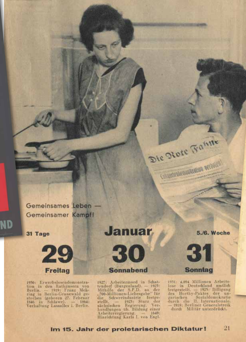
Illustrierter Arbeiter Kalender 1932. 15 Jahre proletarische Diktatur!

Dabei ist neben dem Menschen kein Lebewesen bekannt, das einen so vielfältigen Umgang mit der Zeit entwickelt hat. Es ist uns selbstverständlich, unser Leben zeitlich zu organisieren. Aber viele der Einteilungen sind erst nach und nach entstanden und haben kulturell die unterschiedlichsten Ausprägungen gefunden. Diese Ausstellung widmet sich also weniger der Astronomie, Physik oder Philosophie, sondern vielmehr unserem gesellschaftlichen Umgang mit der Zeit.