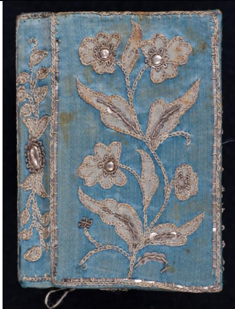
Allg.G.oct.2899-1769 (ES 31) (Zeitschriftenband: keine Beschreibung im SWB möglich)