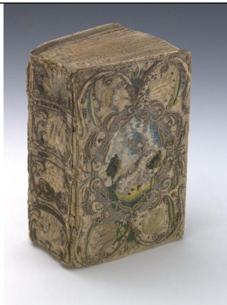
B schwed.163301 (ES 5)