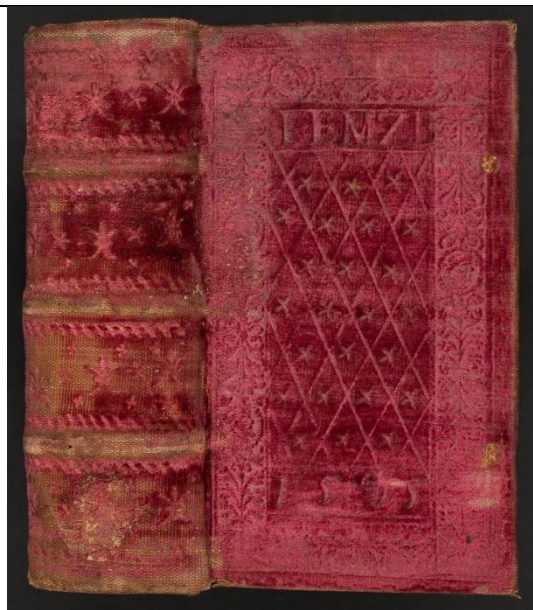
B lat.158402 (ES 9)

wird mit der jeweiligen Signatur (ohne Codierung mit „ES ...“) gesucht. Dort findet man die ausführliche Dokumentation der Einbandgestaltung.