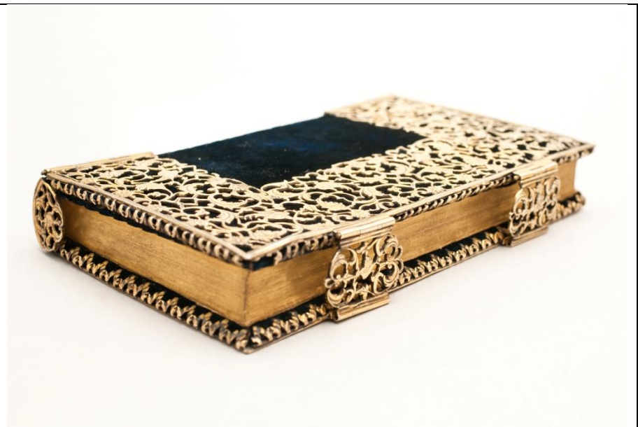
B deutsch 173804 (ES 2)