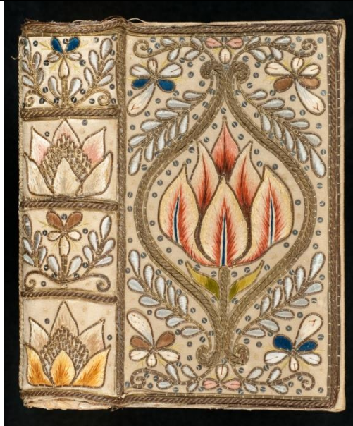
B engl.187002 (ES 40)